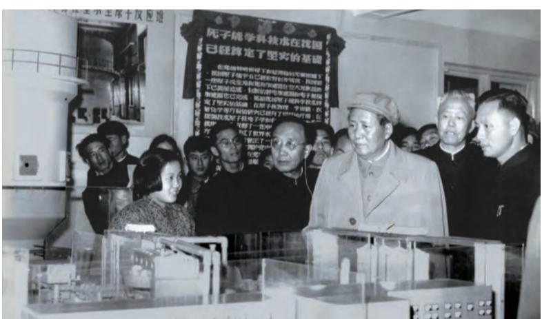
1958年,毛泽东主席参观我国第一座实验性重水反应堆模型

深谋远虑的毛泽东主席,从保卫祖国安全、维护世界和平的战略高度,以伟大政治家的豪迈气魄庄重指出:“我们不但要有更多的中子弹和大炮,还要有原子弹。在今天的世界上,我们要不要人家欺负,就不能没有这个东西!”