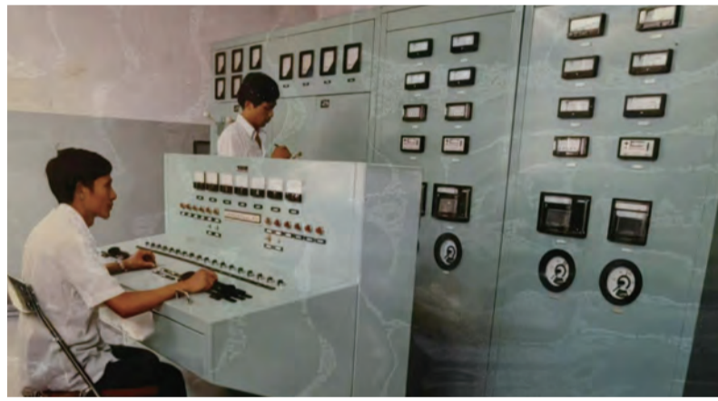
自主研发的高温高压阀门试验装置

1965年4月，我刚完成整理资料的任务，就接到上级通知让我们走，军队来接我们，从兰州出发。当时的我们根本不知道目的地是哪里，整个行程中车队不停靠大站，只在一些小站或者压根没站点的地方歇脚。1965年4月30日，我们到了成都，之后又继续开往宜宾，第二套生产基地定在了宜宾。到了宜宾以后，就借了宜宾农校的教室、大礼堂，工作了大概不到一年，后期因多种原因又把第二套生产基地迁到了四川乐山市金口河，即八一四厂。我们设计院落脚到峨眉山伏虎寺，在伏虎寺里建立一个临时点，既是宿舍也是办公室